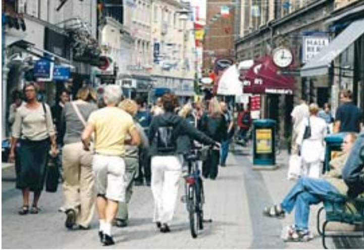
Helsingborg lockar med affärliv och restauranger.

Men även om flest turister hittar till västra Skåne så ökar intresset för hela Skåne. Mellan 2004 och 2007 ökade antalet övernattnings i hela Skåne med 17 procent.