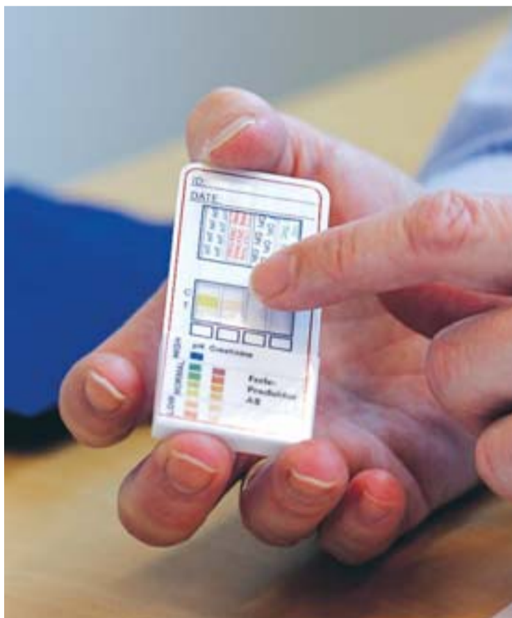
Ögontestaren kompletteras av en liten mätare, nano-stick, förs ner i urinen och utläser snabbt om det finns alkohol eller narkotika i kroppen.